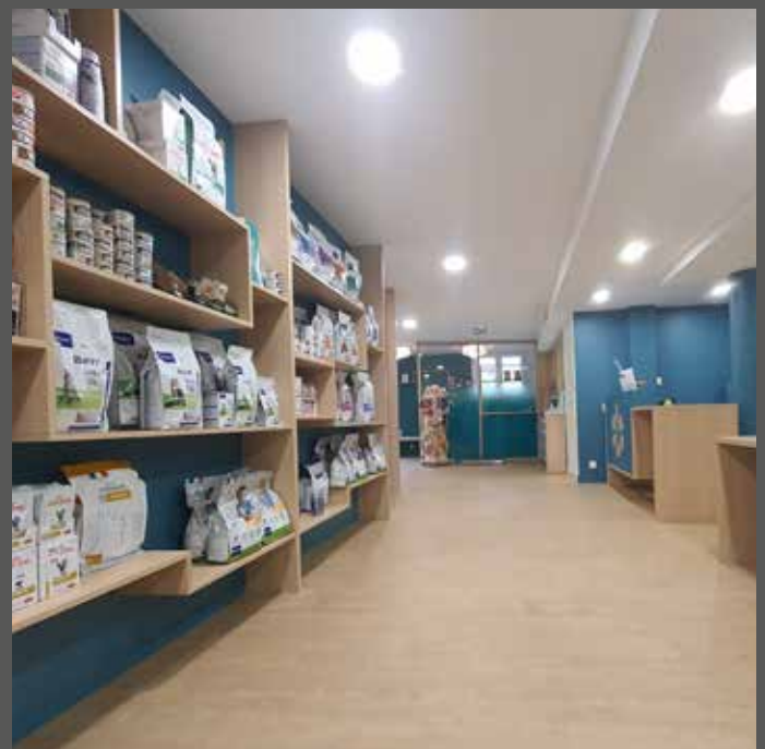
Les espaces ventes

Le laboratoire, la préparation, la stérilisation, les hospitalisations... ces espaces techniques nécessitent une attention particulière dans les flux de circulation comme dans l'ergonomie du mobilier.